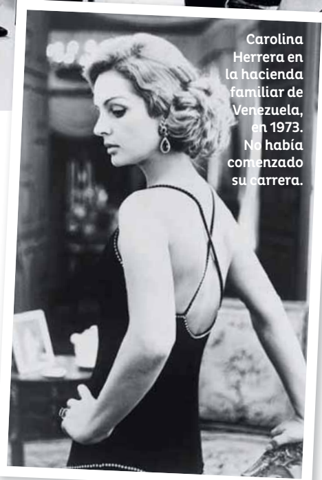
Carolina Herrera en la hacienda familiar de Venezuela, en 1973. No había comenzado su carrera.