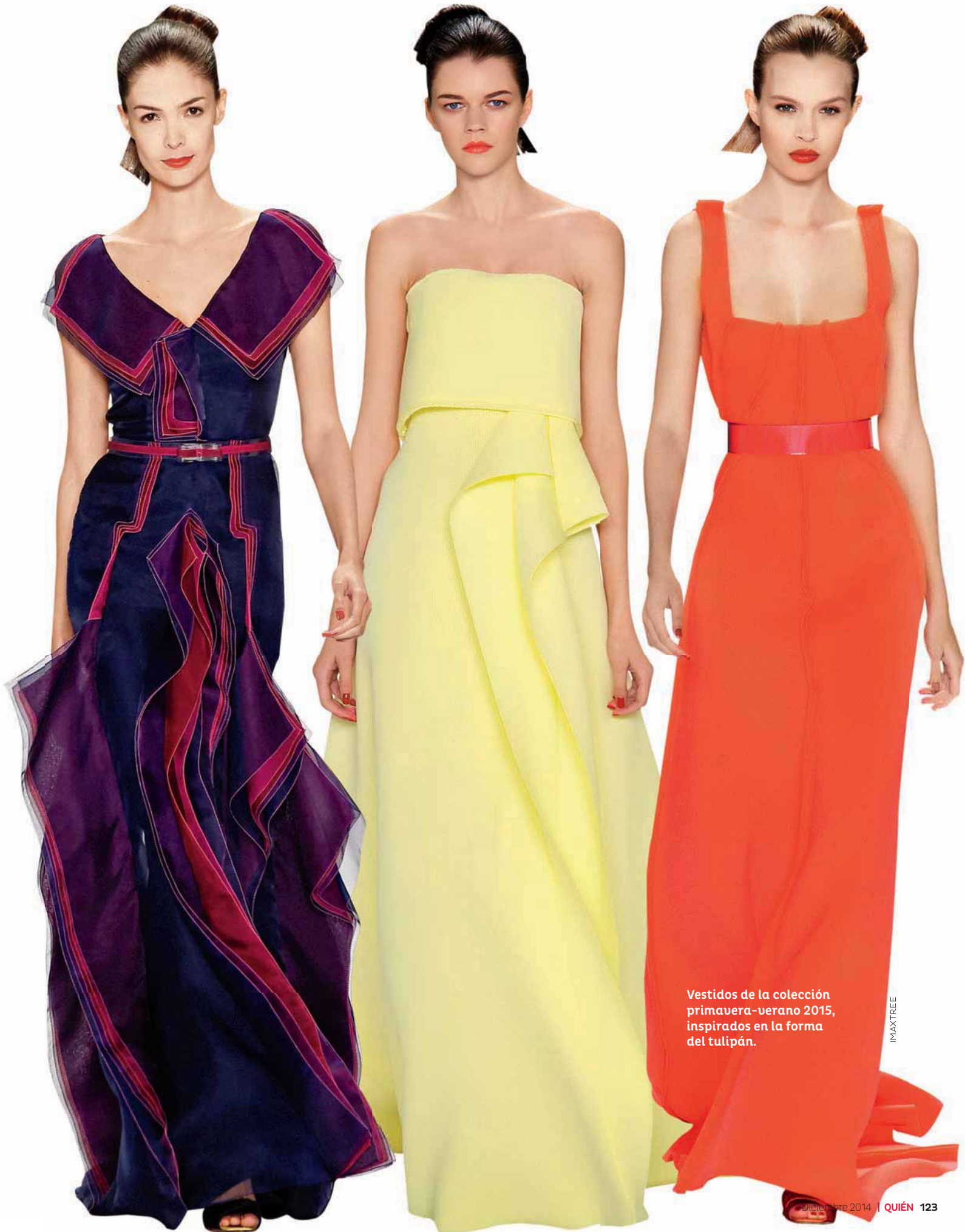
Vestidos de la colección primavera-verano 2015, inspirados en la forma del tulipán.